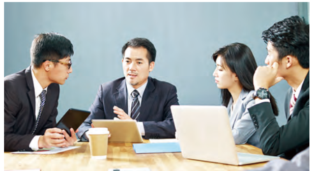
企業が成長し続けるためのプログラム